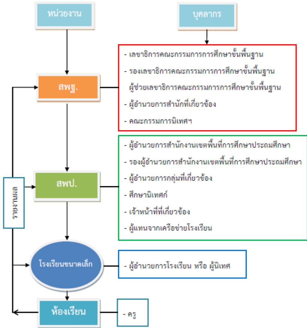
แผนภาพที่ ๒ องค์การนิเทศ กำกับ ติดตาม ประเมินและรายงานผลการจัดการศึกษาทางไกลผ่านดาวเทียม